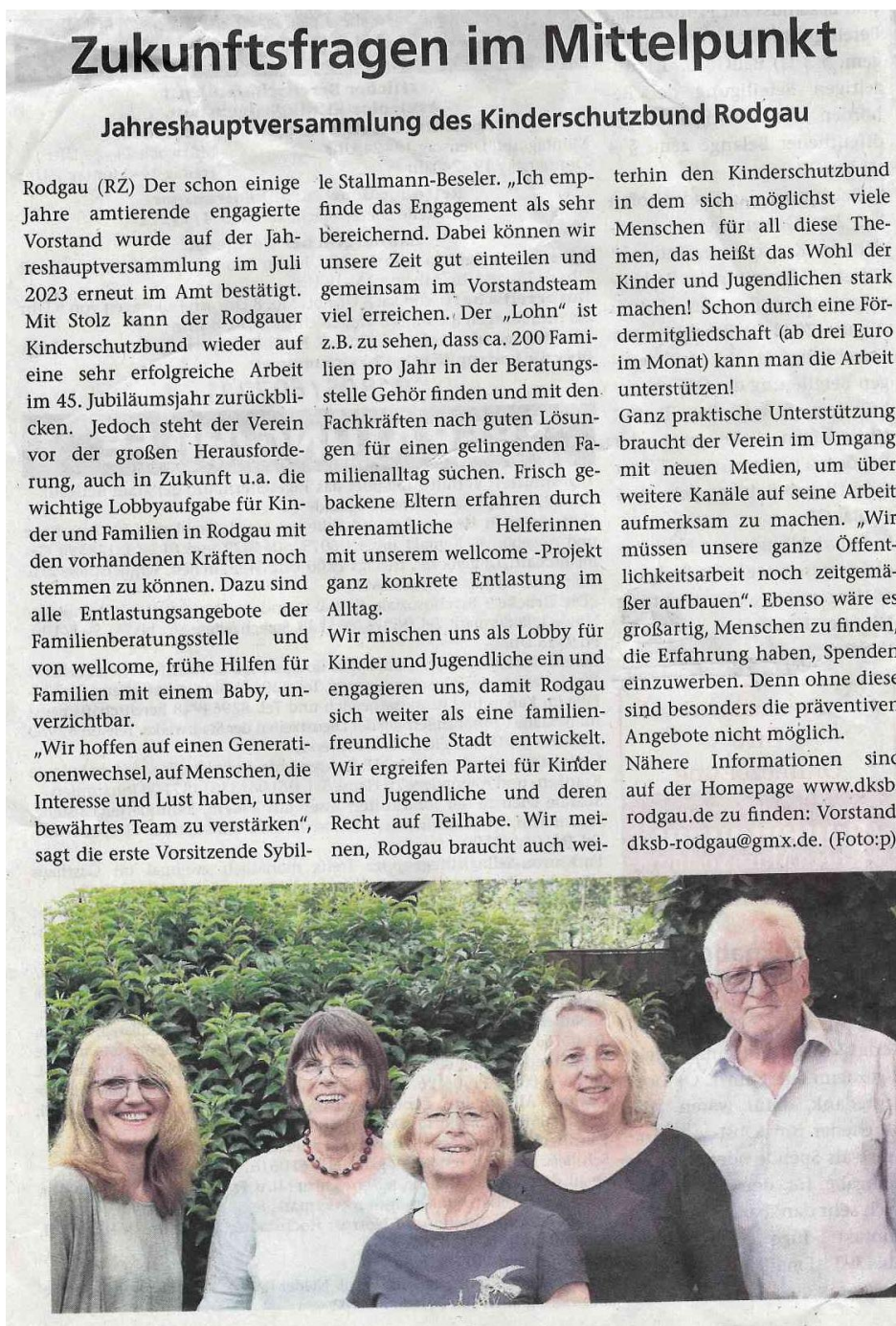
Rodgau-Zeitung v. 22.09.2023