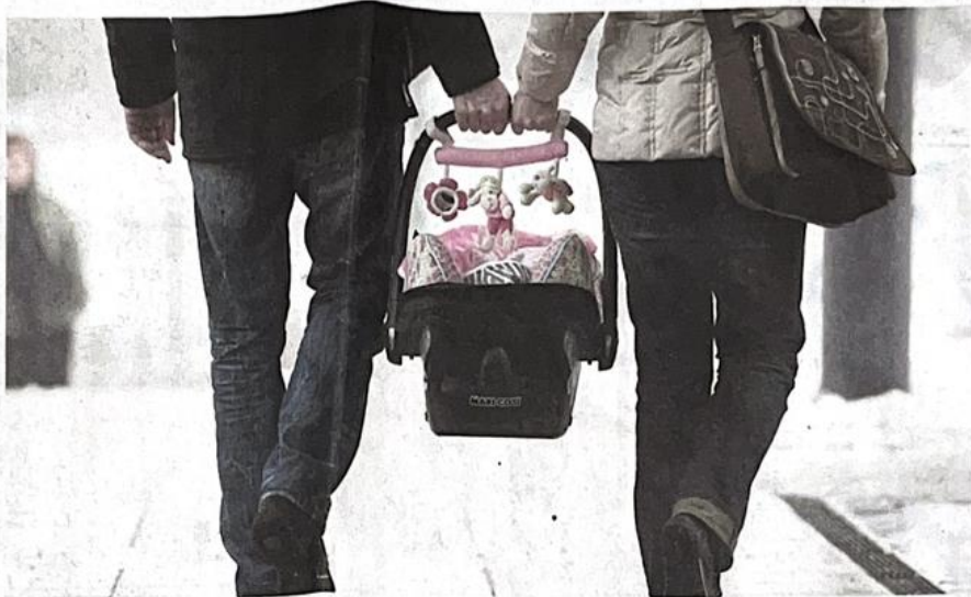
Die Initiative Vaterwelten will Männer befähigen, eine größere Rolle in der Erziehung zu übernehmen.

Früh helfen, Eltern und Kinder stärken, Hilfe und Schutz und gleiche Chancen sind wichtige Grundsätze der